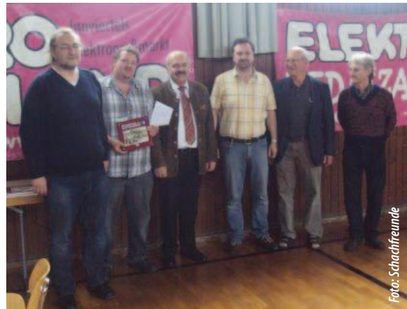
Die Sieger des Landescup 2011 nehmen ihre Preise entgegen.

Gasthaus Schratenecker (dem Vereinslokal) nach einem leckeren „Ripperlessen“ mit Salzburger Schachfreunden die Präsentation einer nicht ganz ernst zu nehmenden Chronik über die letzten 50 Jahre im Vereinsleben der Schachfreunde Mattighofen statt.