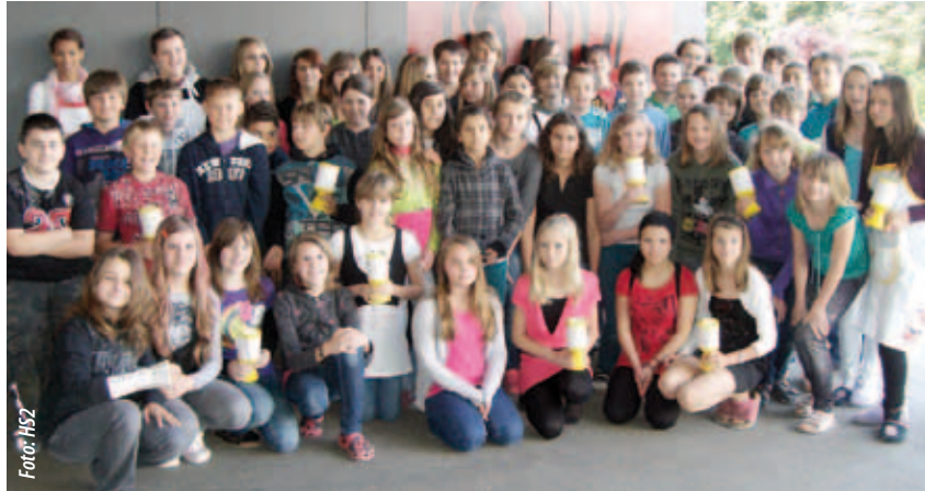
Die Schülerinnen und Schüler der HS2 freuen sich über das gute Ergebnis der Sammelaktion.

Schülerinnen und Schüler der Hauptschule 2 Mattighofen unterstützen die Österreichische Krebshilfe mit einem Betrag von 2222,- Euro. In ihrer Freizeit waren die Schülerinnen und Schüler vor Ostern auf den Straßen in Mattighofen und Umgebung unterwegs und sammelten Spenden für diesen guten Zweck.