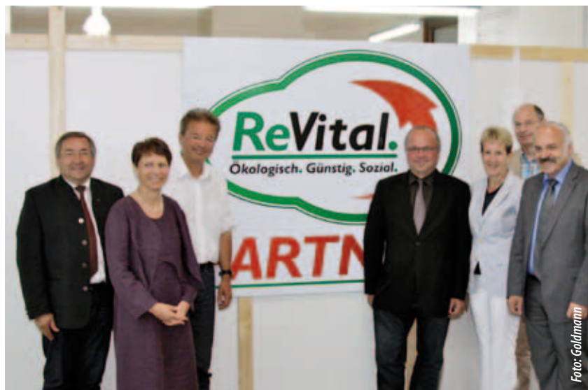
Zur Shop-Eröffnung am 8. Juni stellten sich zahlreiche Gratulanten ein unter anderem auch Landesrat Rudi Anschober.

Menschen aus Mattighofen und Umgebung bietet das Projekt die Chance auf ein sechsmonatiges Dienstverhältnis (beauftragt von AMS und Land OÖ) mit der Möglichkeit, neue Arbeitsgebiete kennen zu lernen und nach längerer Arbeitslosigkeit wieder aktiv zu werden. Ziel der Projektteilnahme ist der Wiedereinstieg in den Arbeitsmarkt, dabei werden die ProjektteilnehmerInnen mit Bewerbungscoaching unterstützt.