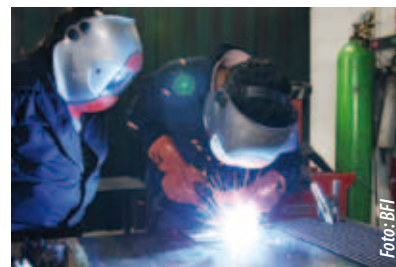
Metall ist einer von vier Fachbereichen in der Produktionsschule Mattighofen.

Alle Werkstätten der Produktionsschule Mattighofen werden wie kleine Firmen geführt, die Produkte herstellen und Dienstleistungen anbieten. Die Produktpalette hat sich