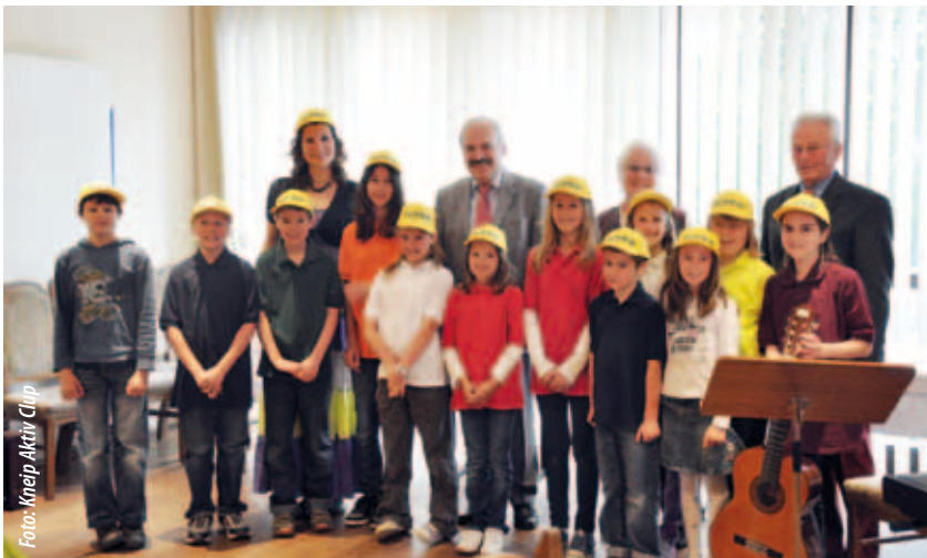
Der Jugendchor der Liedertafel umrahmte die Veranstaltung musikalisch