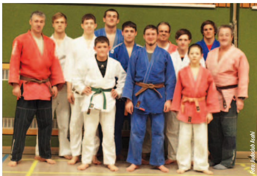
Die neuformierte Mannschaft des Judoclub Asahi schlägt sich tapfer in der Meisterschaft.

Telefonische Auskünfte unter 0676 / 500 93 53